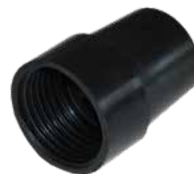
Foto: Skruemuffe type MUHO

Se desuden brochureside for tilbehør til slangevinde type HOSR!