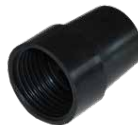
Photo: Manchon à vis type MUHO

Voir aussi la page de la brochure pour l'équipement pour le type d'enrouleur HOSR!