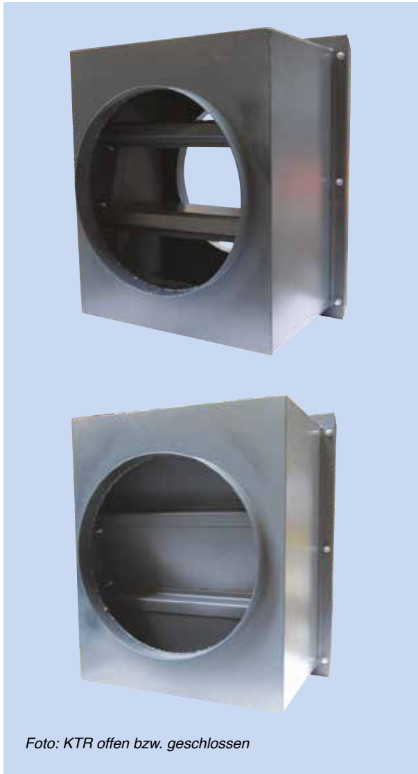
offen bzw. geschlossen