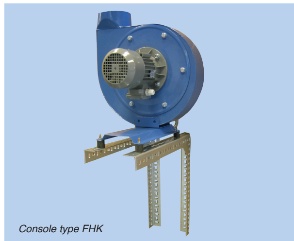
Console type FHK

Convient pour le montage du ventilateur sur les toits plats.