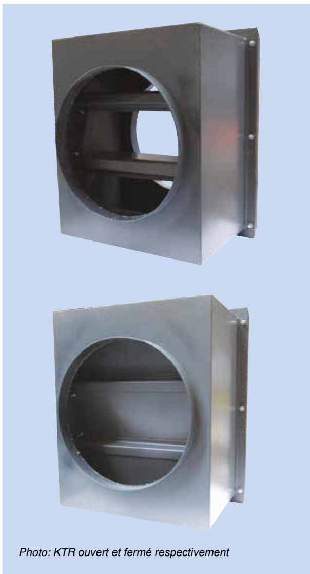
Photo: KTR ouvert et fermé respectivement

Se monte sur les entrées des unités de filtres nettoyés à l'air comprimé pour empêcher le refoulement vers le canal lors du nettoyage des filtres à l'air comprimé. Utilisé pour l'air poussiéreux, mais pas pour les copeaux et autres.