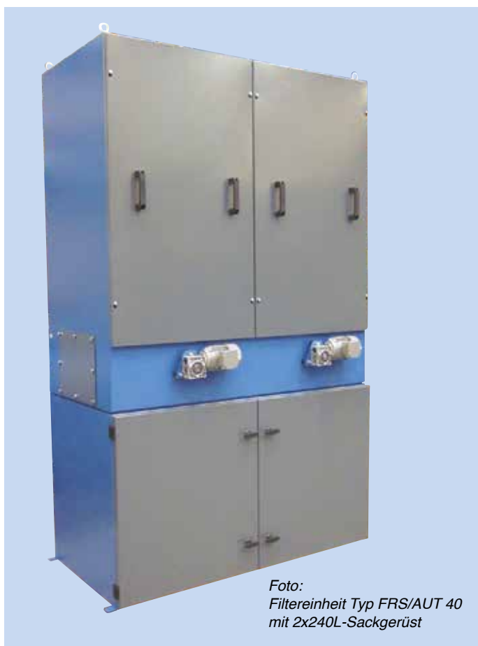
Foto: Filtereinheit Typ FRS/AUT 40 mit 2x240L-Sackgerüst