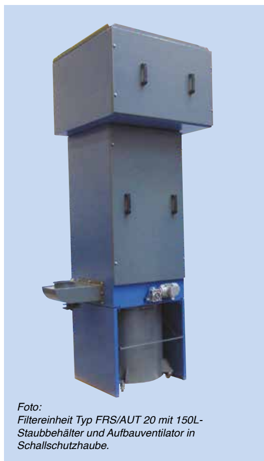
Foto: Filtereinheit Typ FRS/AUT 20 mit 150L- Staubbehälter und Aufbauventilator in Schallschutzhaube.