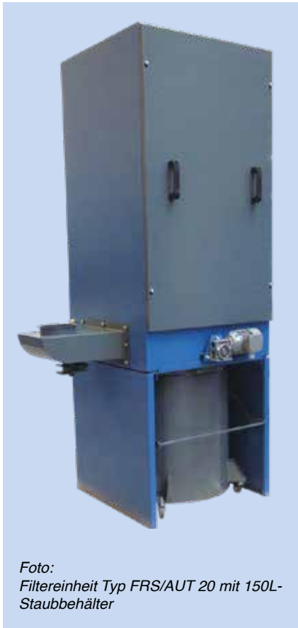
Foto: Filtereinheit Typ FRS/AUT 20 mit 150L- Staubbehälter

Kompakte Filteranlage mit manueller oder automatischer Roto-Reinigung (FRS MAN oder FRS AUT). Geeignet für Anwendung an Ausbildungsinstitutionen und in kleineren Werkstätten o.ä., wo sowohl von Maschinen abgesaugt werden soll als auch Abgriff für Reinigung verwendet wird. Ist erhältlich als Einzelkabinett mit 10 bis 20m 2 -Filterareal und als Doppelkabinett mit 40m 2 -Filterareal.